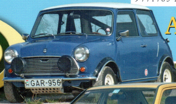
AUSTIN Mini Görögtűz