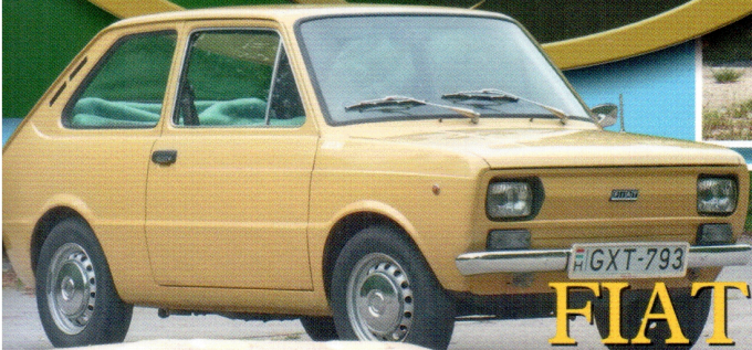
FIAT 133 Álpolski