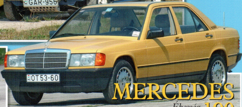
MERCEDES E-kesség 190