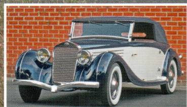
A Delage története Idomszer