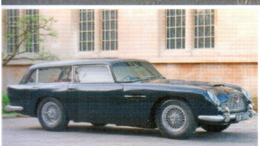
A Radford műhely Nehéz vasakból