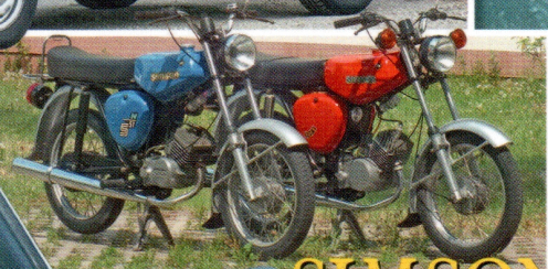
SIMSON S50 S51